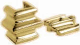
Rfe. medidas en m/m ↓ ↔ □ 17-017 40 x 40 16 17-018 40 x 40 20