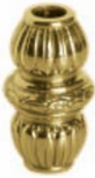
Rfe. medidas en m/m ↓ ↔ ∅ 17-070 110 x 45 20