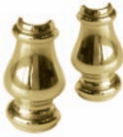
Rfe. medidas en m/m \downarrow \leftrightarrow \emptyset 17-095 80 x 40 16