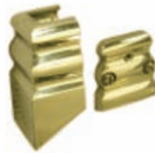
Rfe. medidas en m/m \downarrow \leftrightarrow \square 17-104 60 x 35 16