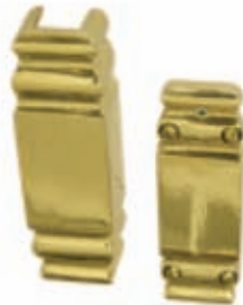
Rfe. medidas en m/m \downarrow \leftrightarrow \square 17-103 115 x 35 16