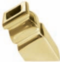
Rfe. medidas en m/m ↓ ↔ □ 17-011 60 x 30 16 17-012 60 x 30 20