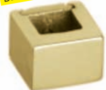
Rfe. medidas en m/m ↓ ↔ □ 17-030 20 x 20 16