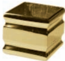
Rfe. medidas en m/m \downarrow \leftrightarrow \square 17-109 43 x 48 30 17-110 43 x 48 40