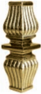
Rfe. medidas en m/m ↓ ↔ □ 17-001 150 x 50 16 17-002 150 x 50 20