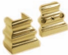
Rfe. medidas en m/m ↓ ↔ □ 17-019 40 x 38 16 17-020 40 x 38 20