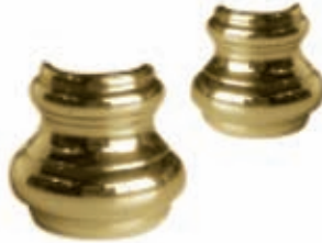
Rfe. medidas en m/m \downarrow \leftrightarrow \emptyset 17-099 30 x 38 16