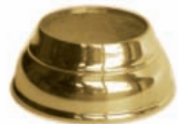
Rfe. medidas en m/m \downarrow \leftrightarrow \emptyset 17-114 33 x 75 40 17-115 38 x 90 50