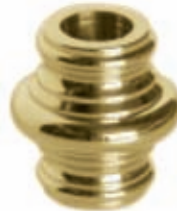
Rfe. medidas en m/m ↓ ↔ Ø 17-055 45 x 40 16 17-056 45 x 40 20