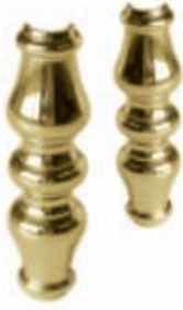
Rfe. medidas en m/m \downarrow \leftrightarrow \emptyset 17-094 140 x 38 16