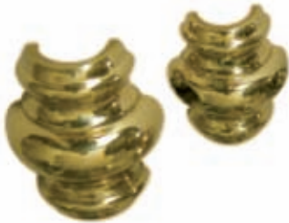
Rfe. medidas en m/m \downarrow \leftrightarrow \emptyset 17-098 45 x 38 16