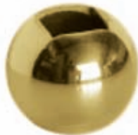
Rfe. medidas en m/m ↓ ↔ □ 17-079 45 x 45 16 17-080 55 x 55 20