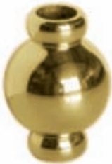
Rfe. medidas en m/m ↓ ↔ ∅ 17-078 80 x 54 20