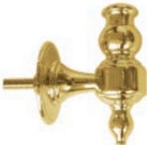
Rfe. medidas en m/m ↓ ↔ ∅ 17-086 130 x 95 16