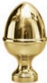
Rfe. medidas en m/m ↓ ↔ ● base 17-258 65 x 45 24 M6 17-259 105 x 60 35 M12 17-260 145 x 80 44 M12