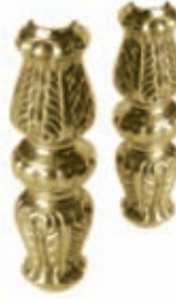
Rfe. medidas en m/m \downarrow \leftrightarrow \emptyset 17-096 140 x 40 16