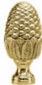
Rfe. medidas en m/m ↓ ↔ ● base 17-261 110x 55 33 17-262 130x 70 40 17-263 150x 80 43