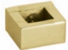
Rfe. medidas en m/m ↓ ↔ □ 17-023 20 x 38 20