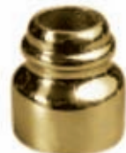
Rfe. medidas en m/m ↓ ↔ Ø 17-065 45 x 40 20 17-066 45 x 40 25