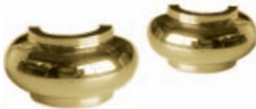
Rfe. medidas en m/m \downarrow \leftrightarrow \emptyset 17-102 22 x 38 16