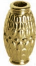
Rfe. medidas en m/m ↓ ↔ ∅ 17-073 110 x 45 20