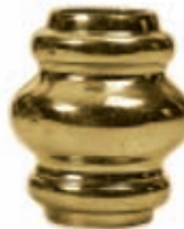
Rfe. medidas en m/m ↓ ↔ Ø 17-063 50 x 45 20 17-064 50 x 45 25