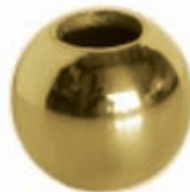
Rfe. medidas en m/m ↓ ↔ ∅ 17-081 45 x 45 16 17-082 55 x 55 20