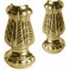
Rfe. medidas en m/m \downarrow \leftrightarrow \emptyset 17-097 78 x 40 16