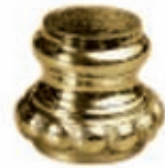
Rfe. medidas en m/m ↓ ↔ Ø 17-047 30 x 40 16 17-048 30 x 40 20