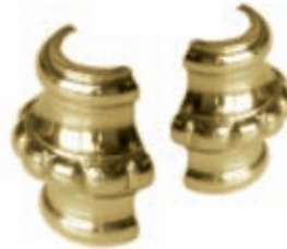
Rfe. medidas en m/m \downarrow \leftrightarrow \emptyset 17-100 45 x 38 16