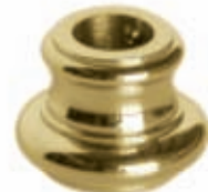
Rfe. medidas en m/m ↓ ↔ Ø 17-057 35 x 40 16 17-058 35 x 40 20