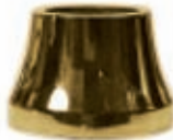
Rfe. medidas en m/m ↓ ↔ Ø 17-053 30 x 45 20 17-054 30 x 45 25