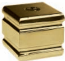
Rfe. medidas en m/m \downarrow \leftrightarrow \square 17-107 36 x 43 30 17-108 36 x 43 40