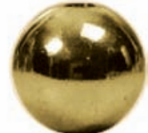
Rfe. medidas en m/m ↓ ↔ ∅ 17-083 20 x 20 6 17-084 25 x 25 6 17-085 30 x 30 6