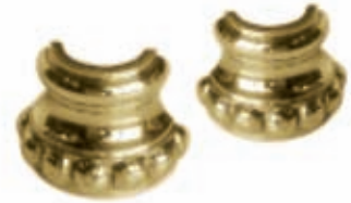
Rfe. medidas en m/m \downarrow \leftrightarrow \emptyset 17-101 30 x 38 16