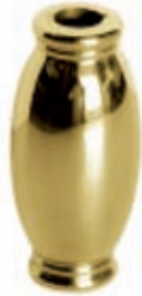
Rfe. medidas en m/m ↓ ↔ ∅ 17-071 110 x 45 20