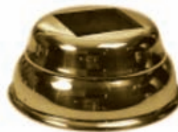
Rfe. medidas en m/m \downarrow \leftrightarrow \square 17-111 33 x 75 25 17-112 36 x 85 30 17-113 50 x 105 40