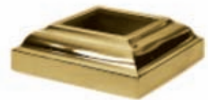
Rfe. medidas en m/m \downarrow \leftrightarrow \square 17-105 25 x 80 30 17-106 25 x 80 40