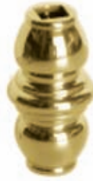
Rfe. medidas en m/m ↓ ↔ ∅ 17-072 110 x 45 20