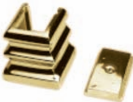
Rfe. medidas en m/m ↓ ↔ □ 17-026 40 x 38 16 17-027 40 x 38 20