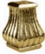
Rfe. medidas en m/m ↓ ↔ □ 17-003 60 x 45 16 17-004 60 x 45 20