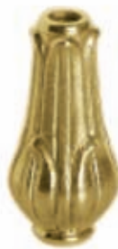
Rfe. medidas en m/m ↓ ↔ ∅ 17-075 120 x 55 20